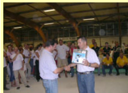
Le Second A reçu une perceuse visseuse et 50 euros en bons d'achats AUCHAN