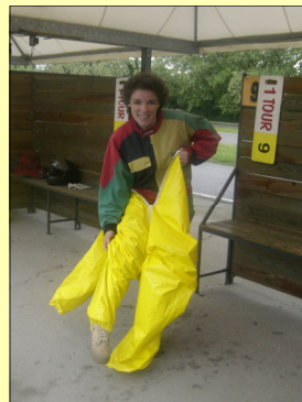
Pas envie de se mouiller...