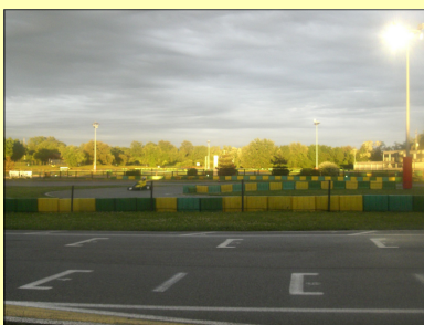
Qui a dit qu'il pleuvait ce jour là ? Eh bien non juste de quoi bien tremper la piste avant, pour le spectacle...