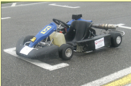
Les karts au couleur de Chez SOPHIE et VEOLIA

Nos sponsors pour cette manifestation Un grand Merci à eux !