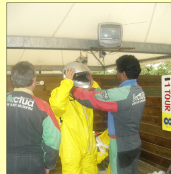
Coincé dans son casque ?